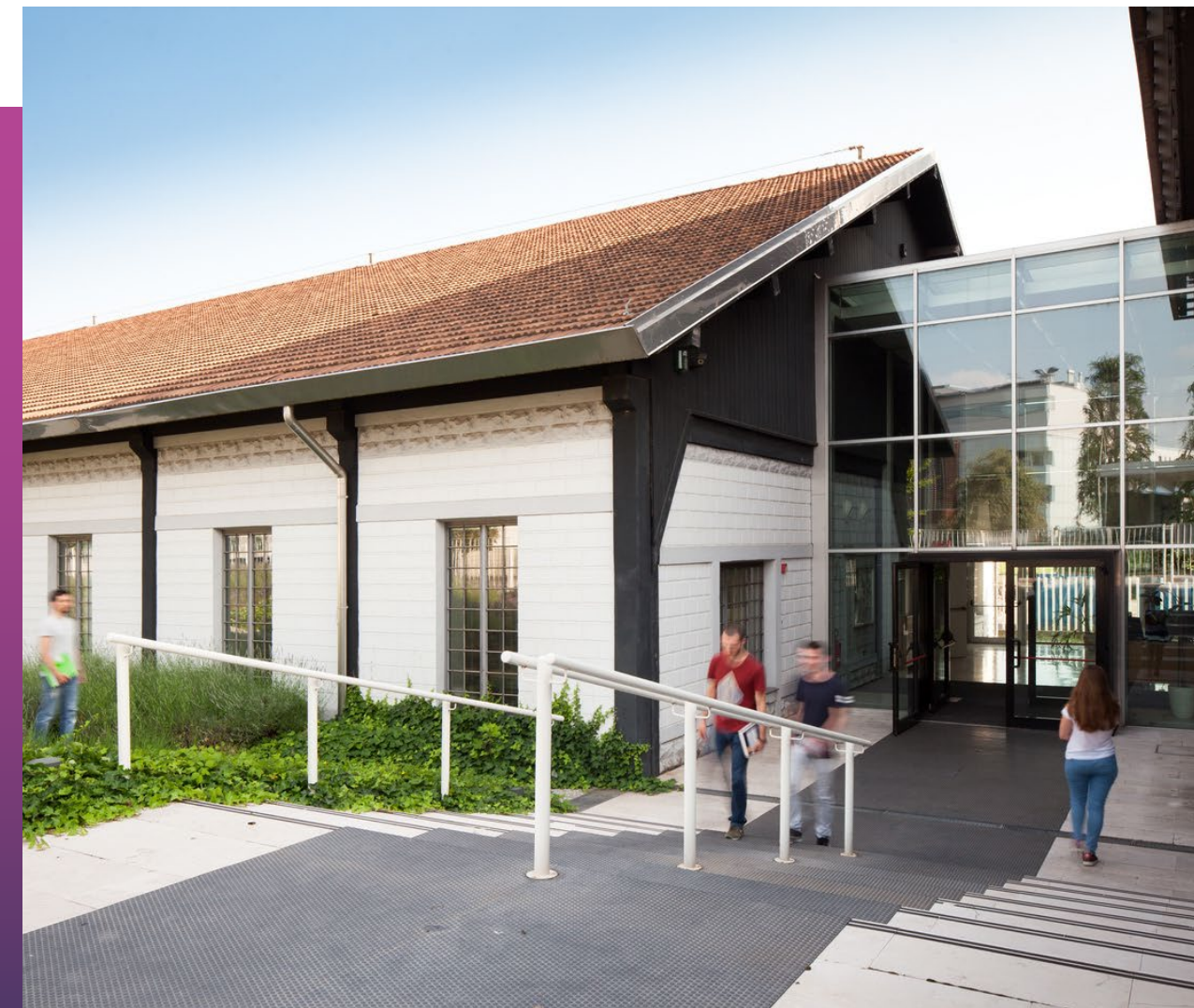
LABORATORI SCUOLA DI INGENERIA UNIBG Dalmine