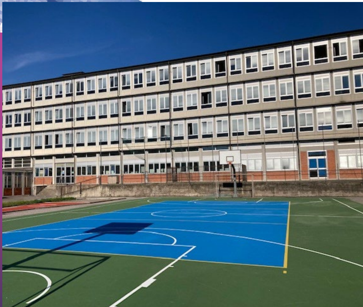
LABORATORI IPIA PESENTI Bergamo